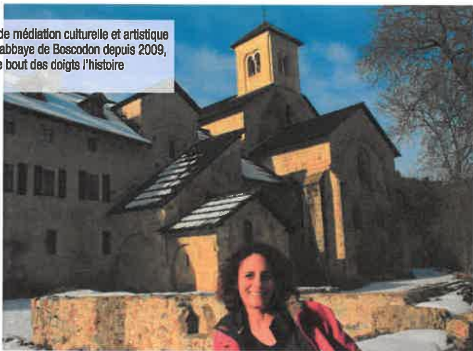
« L'architecture est romane, mais dans un style roman beaucoup plus lumineux et haut que d'habitude. »

L.Z. Les membres fondateurs étaient religieux et laïques. Actuellement, il reste deux moines dominicains et des messes sont célébrées tous les dimanches, mais l'association n'est pas religieuse, elle organise notamment de nombreux événements culturels.