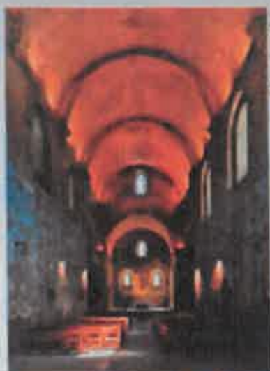
Même encore partiellement restaurée, l'abbaye impose. L'abbatiale a conservé son dépouillement original (XII e siècle).