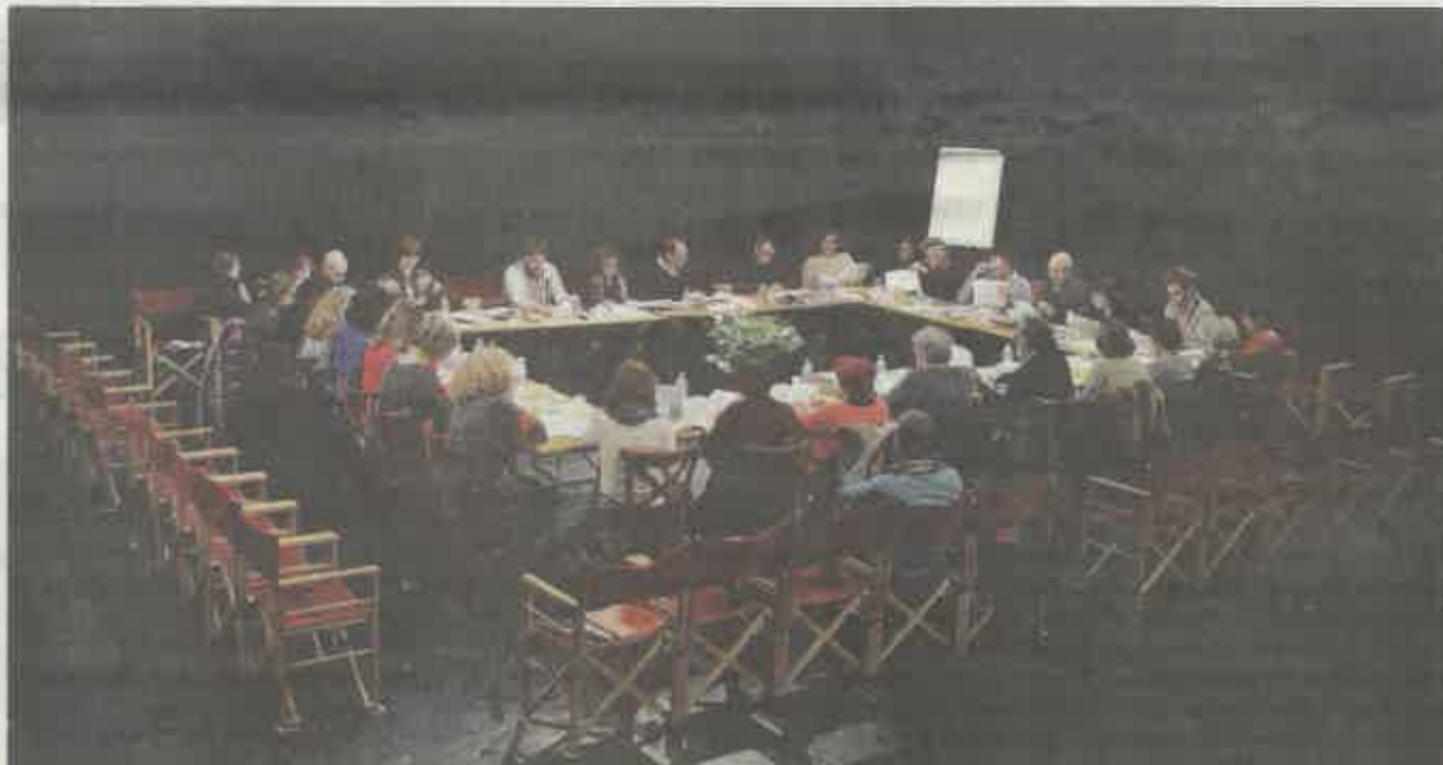
"Cherchez la faute !" sera en tournée dans le nord du département du 12 au 15 octobre.

Vrai spectacle mettant en scène un faux séminaire d'exégètes, "Cherchez la faute !" invite les spectateurs à une plongée dans l'Ancien testament. D'après l'essai, la Divine origine/ Dieu n'a pas créé l'homme de Marie Balmay, trois comédiens invitent le public autour d'une table pour explorer ensemble chaque mot, chaque sens et chaque mystère des premiers chapitres de la Genèse. Le public doit alors lire "comme si c'était la première fois, comme s'il ne savait rien de ce mythe fondateur". Dans le texte, il n'y a aucune trace de faute ou de péché ni de châtiement. Il ne s'agit pas d'une lecture religieuse, mais d'abord éthique et philosophique, pour tenter de comprendre le texte et les grandes interrogations de la