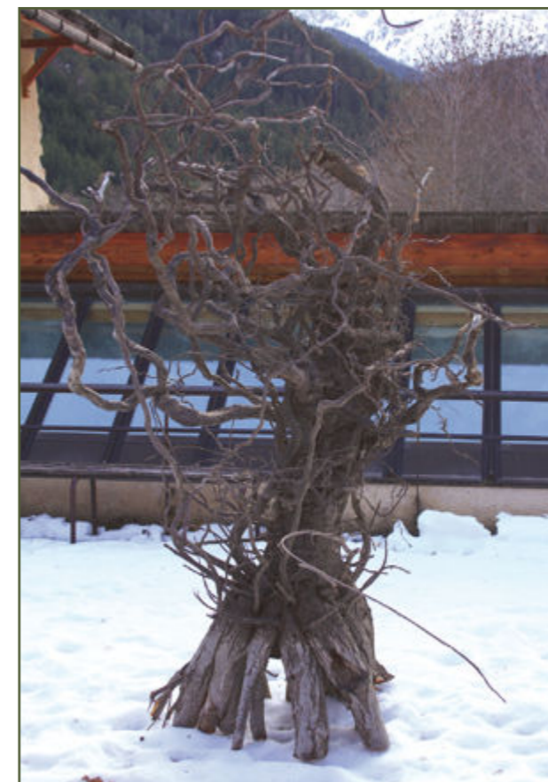
Un arbre échoué

Du « jardin d'enfants » jusqu'au trépas, notre existence humaine s'efforce, avec plus ou moins de succès, de réaliser cette fécondité.