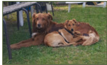
Moustik et Spring, les compagnons fidèles de Cédric et Céline