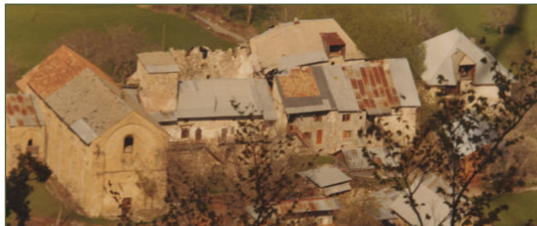
L'abbaye en 1972