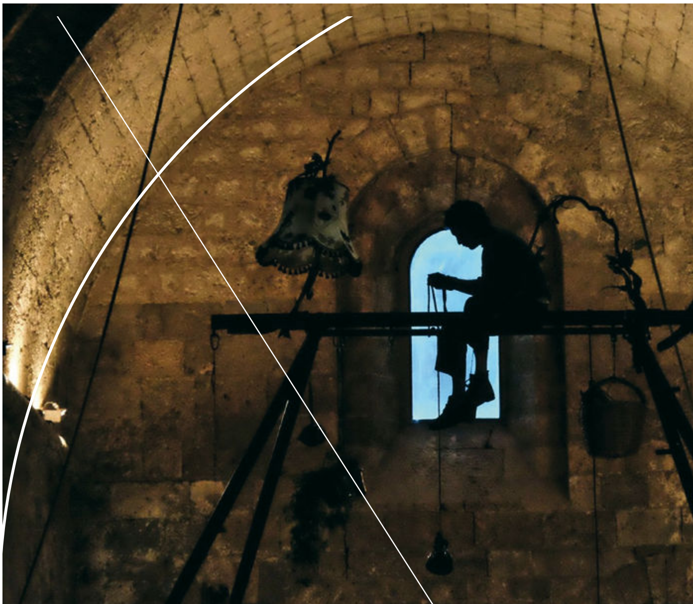
Image d'un spectacle vivant dans l'église abbatiale