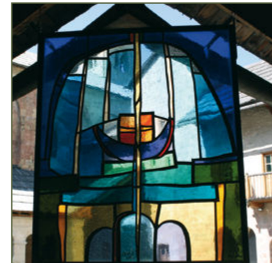
Exposition Gilles Alfera